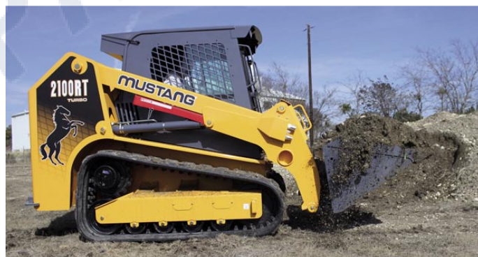
Гусеничный мини погрузчик MUSTANG 2100RT с низкопрофильным ковшом